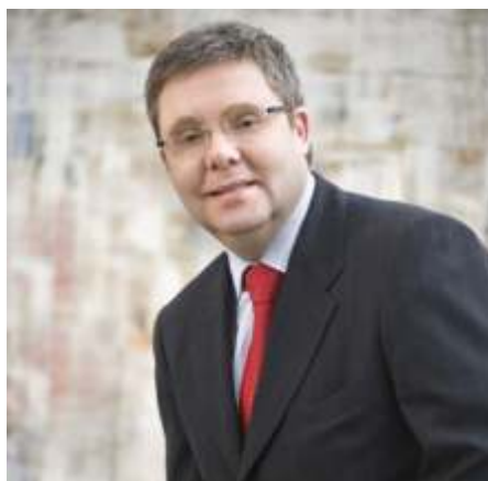
Cassel: faltam consultorias especializadas

A inovação é tema do momento, um fenômeno do mercado, fundamental para vencer os desafios cada vez maiores da globalização e da competitividade. A Lei do Bem, assim chamada